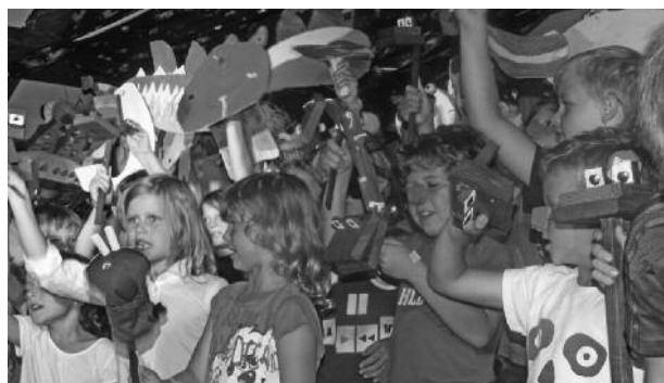
Zaključna prireditev Tedna mladih umetnikov je navdušila

telji lahko ogledali pisan spored delovanja med tednom. Občudovali so slike in druge umetnine, ki so nastale v okviru tega tedna in bodo otrokom in staršem ostali v lepem spominu. Otroci so s pisano predstavo na duhovit način predstavili kratko zgodovino gledališča, od začetkov do danes. Med tednom so si udeleženci kreativnega tedna lahko ogledali tudi predstavo Zvezdica Zaspanka, ki jo je v farni dvorani v Železni Kapli uprizorila skupina gledališke šole KPD Šmihel.