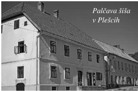
Palčava šiša v Pleščih

V soboto, 15. septembra 2012, je v Palčavi šiši v Pleščih potekala mednarodna delavnica na temo »Nesnovna kulturna dediščina na primeru obmejnega območja doline Zgornje Kolpe in Čabranke ter okolice«. Na posvetu, ki ga je organiziralo Slovensko etnološko društvo, je bil izpostavljen pomen živega ohranjanja narečnih govorov prebivalcev tega obmejnega območja. Gre za odmaknjeno in med sabo povezano območje,