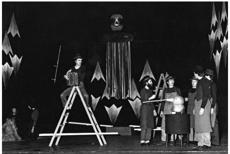
Leta 1985 so domači igralci v Mestnem gledališču v Celovcu uprizorili Kurenta

Letos se spominjamo 100-letnice rojstva Vinka Zaletela, ki mu je, kot gorečemu ljubitelju gledališča, uspelo zadržati ljubezen do te stroke v krajih, kjer je