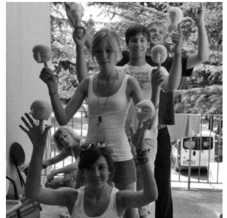
Ena od 20 skupin v Ankaranu: Lutkovna skupina Pika SKD Celovec