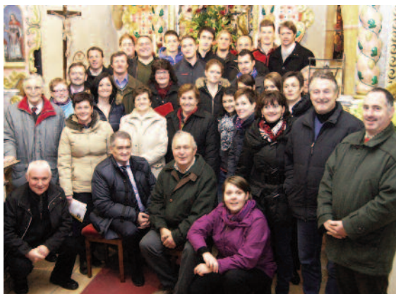
Pevci MePZ PD Obirsko