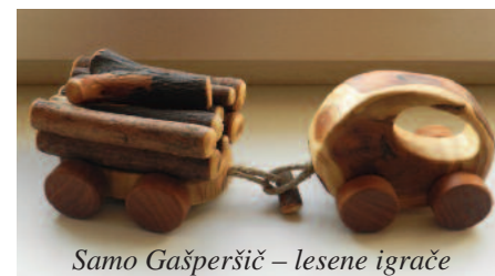
Samo Gašperšič – lesene igrače