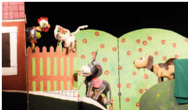
Lutkovna predstava Štirje fantje muzikantje