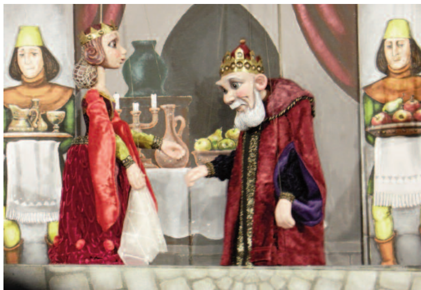
Lutkovna predstava Vitez Bajaja (Slovaška)

Že tretjič je šmihelsko društvo sodelovalo z otroki ene izmed bližnjih šol. Ni torej slučaj, da gledališče in lutkarstvo v okolici uživata precejšen ugled že med mladimi. Naslednje leto se bo sodelovanje z najmlajšimi nadaljevalo, načrtujejo še nekaj posebnosti – sedaj le toliko: naslednji Cikel Cakl utegne biti še bolj pester od letošnjega!